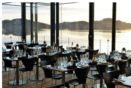
Restaurang Vatten vid Akvarellmuseet

Vid ev frågor, kontakta någon ur konstresegruppen: